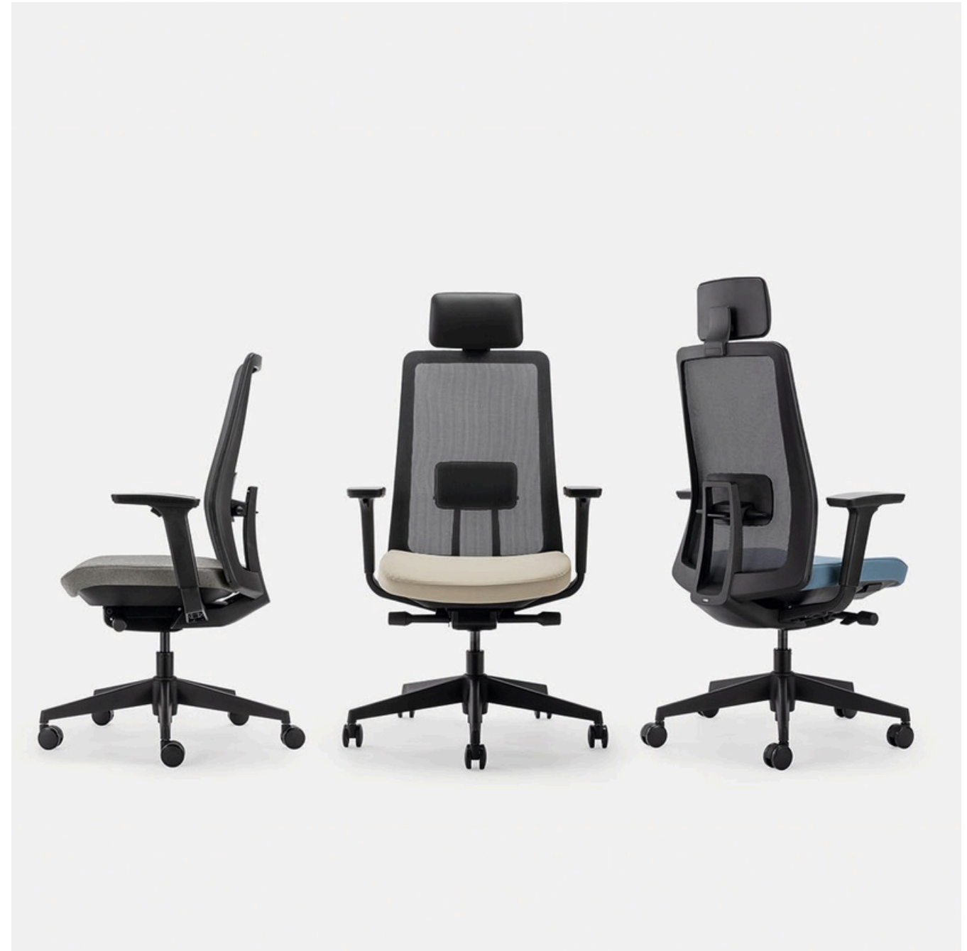
€ 500,00 SMESH0.419.A02 - TN 9801 Concrete