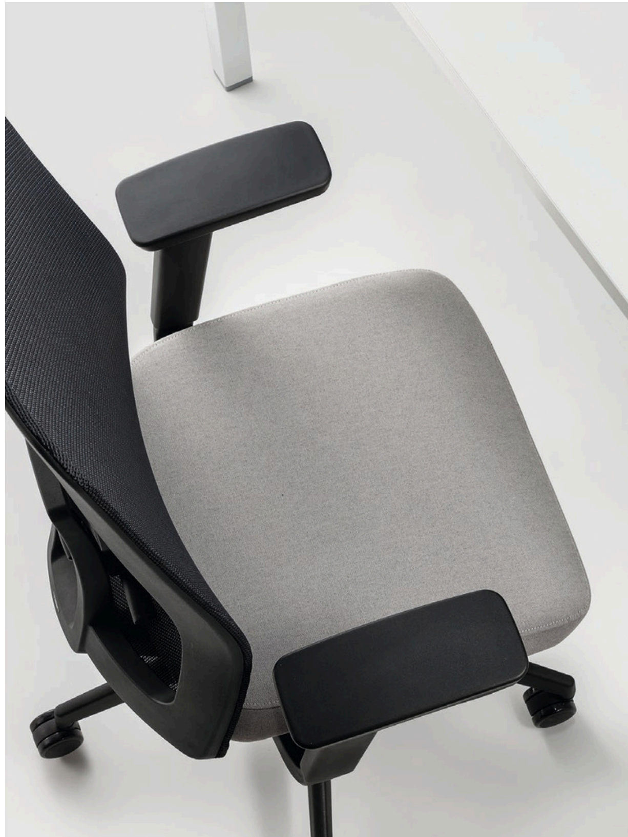
€ 500,00 SMESH0.419.A02 - TN 9801 Concrete